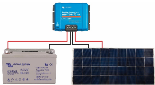
Figure 1: Power connections