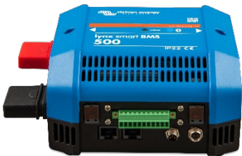
Lynx Smart voor hoek