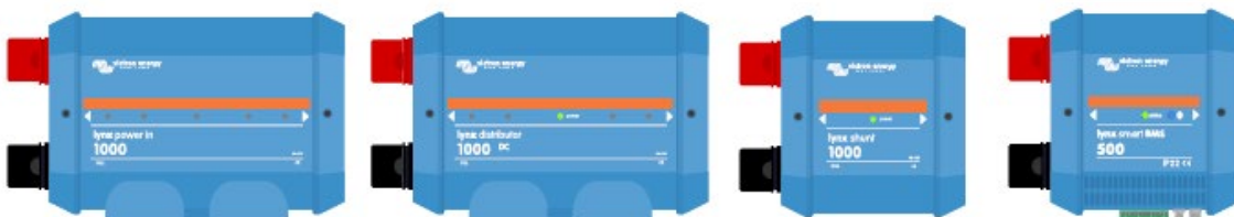
De Lynx-modules: Lynx Power In, Lynx Distributor, Lynx Shunt VE.Can en Lynx Smart BMS